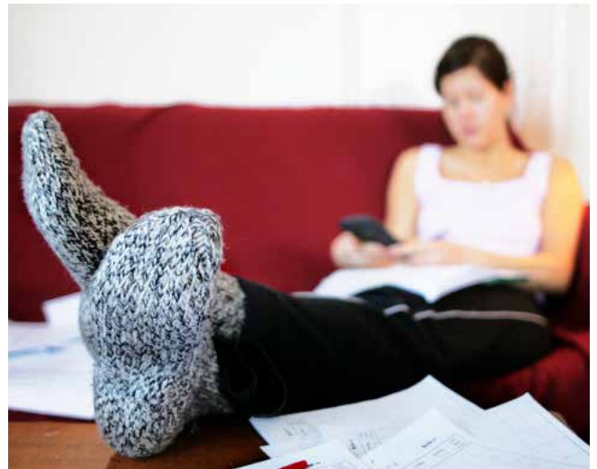
Det är normalt att temperaturen är något lägre vid golvet.