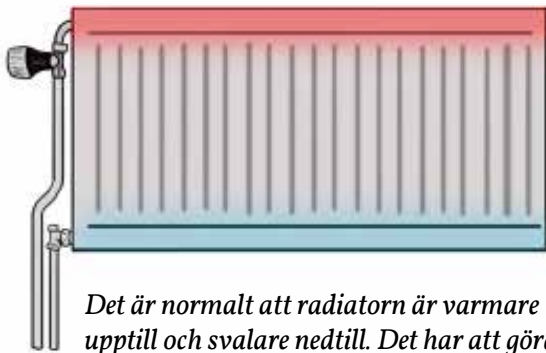
Det är normalt att radiatören är varmare upptill och svalare nedtill. Det har att göra med hur värmen cirkulerar i radiatören.